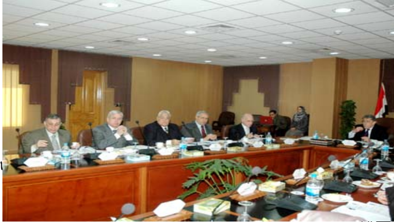
اعانت كلية العلوم حضر

عقد مركز تطوير الأداء بـ الجلسة العلمية الأولى عدد تقدم للمؤتمر 73 بحث و 5 المشاركة في مشروع تحت